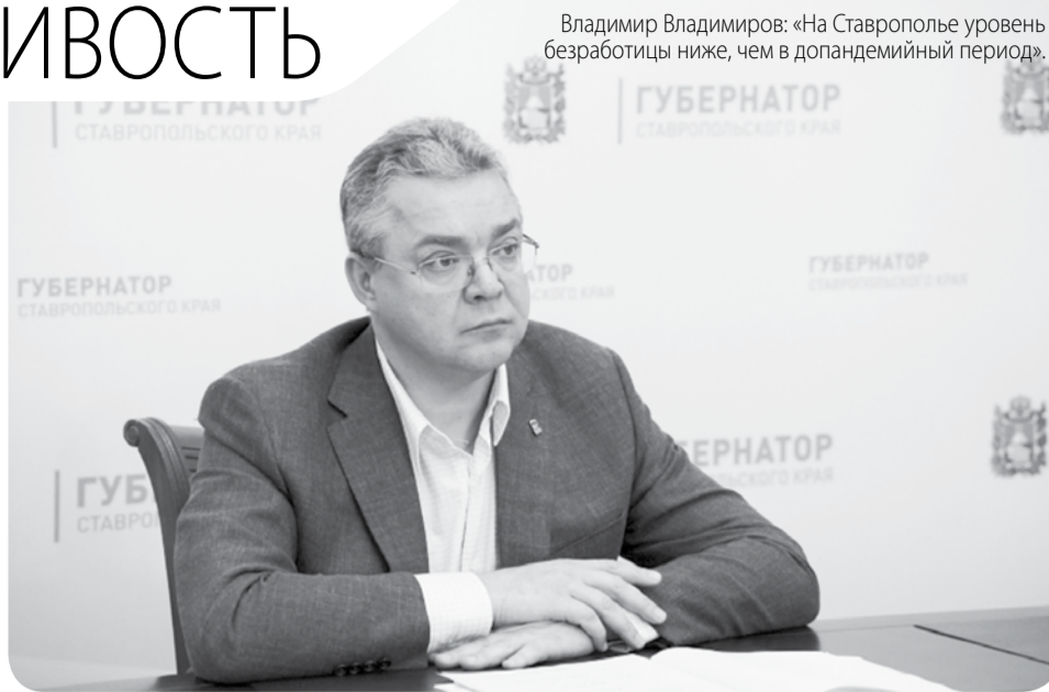
Владимир Владимирович: «На Ставрополье уровень безработицы ниже, чем в допандемийный период».

– Предпринимаемые усилия для устойчивости развития краевой экономики позволили нивелировать влияние от западных санкций. Число субъектов малого и среднего предпринимательства в крае растёт, выполняются показатели поступлений в бюджеты. Тем не менее необходимо держать руку на пуль-