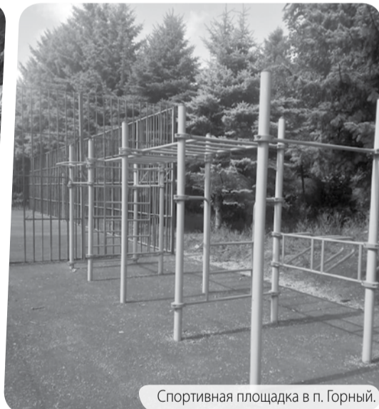
Спортивная площадка в п. Горный.