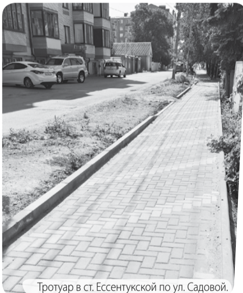
Тротуар в ст. Ессентукской по ул. Садовой.

Отметим, реализация краевой программы местных инициатив будет продолжена и в 2023 году. Конкурсный отбор прошёл 191 проект. Среди них – благоустройство территорий, ремонт объектов культуры, приведение в порядок дорог местного значения. Для их реализации из краевого бюджета будет выделено 362 миллиона рублей.